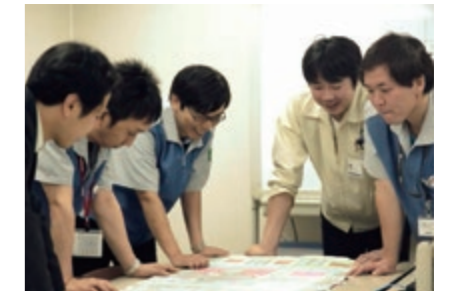
多様な技術を結集した開発チームが新製品を生み出します Development team, composed of staffs possessing various techniques, incubating new products