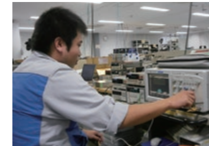
検証実験を積み重ねた新製品がお客様へ新たな付加価値を提供します Engineering staff inspecting new products to provide customers with added-value