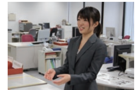
管理系スタッフも、専門知識と行動力で経営効率を高めています Administration staff improving management efficiency with expertise and quick action