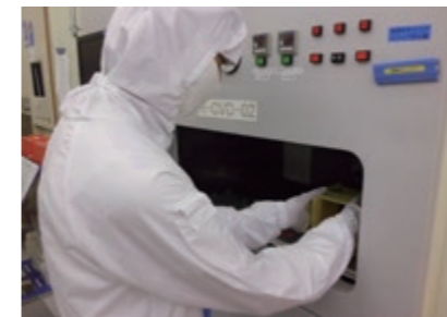
製品品質を向上させるために日々、改善活動に取り組んでいます Production staff working hard every day to improve product quality