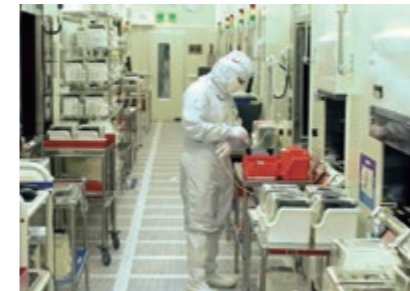
クリーンな環境の中で、安全・確実な生産活動を行っています Production staff working safely and steadily in a clean room